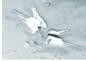
03 179

Die GUV/FAKULTA unterstützte den Kollegen mit 9.200 Euro Schadenersatzbeihilfe.