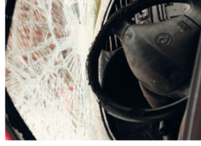
10 178 | © Digistock / A. Möller

Kollegin G. erlitt auf dem Arbeitsweg einen Steinschlag. Kosten: 800 Euro. Nach der Reparatur wurde von der Versicherung ein Selbstbehalt von 300 Euro eingefordert.